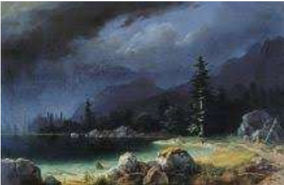
Marko Pernhart, Klanško