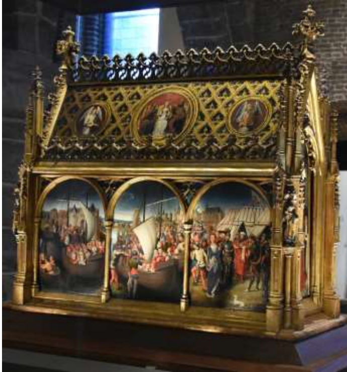
Hans Memling, Relikviarji Sv. Uršule