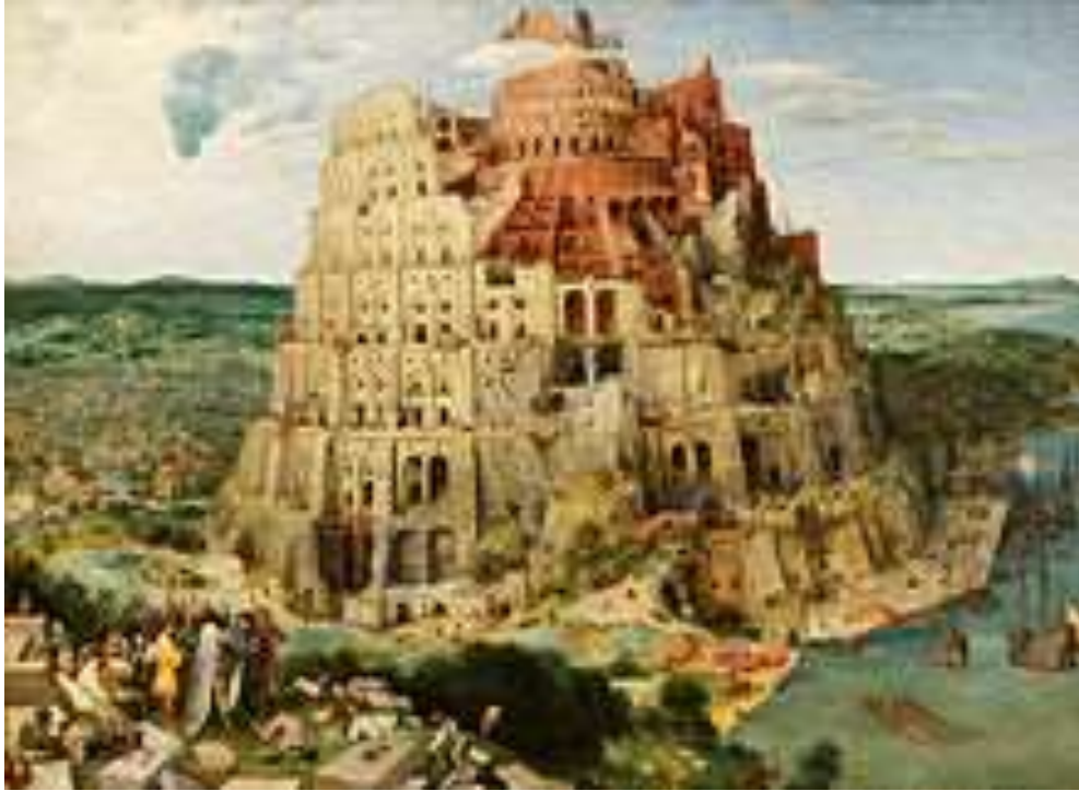
Pieter Bruegel, Babilonski stolp