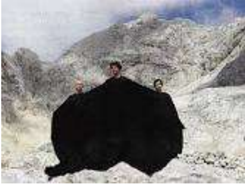
Janez Janša, Janez Janša, Janez Janša, Triglav