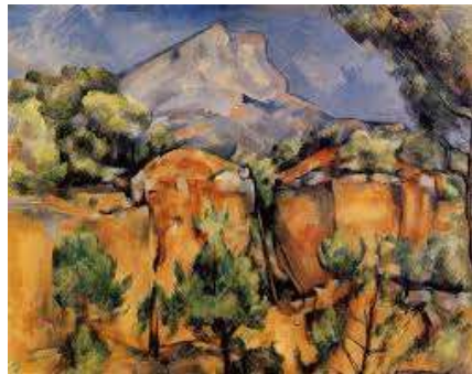
Paul Cezanne Gora St Victoa