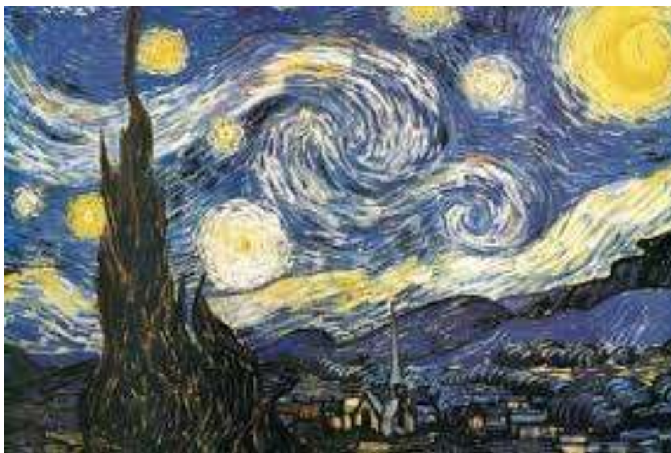
Van Gogh, Zvezdnata noč