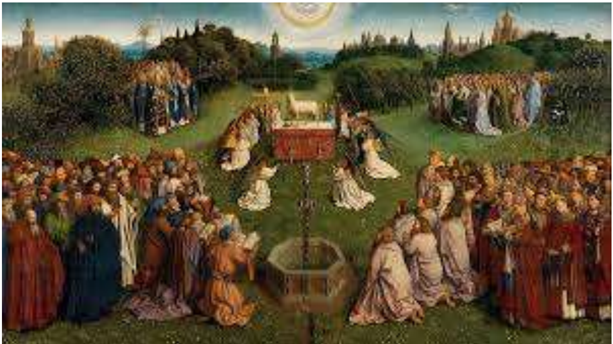
Yann van Eycke, Detajl iz Gentskega oltarja