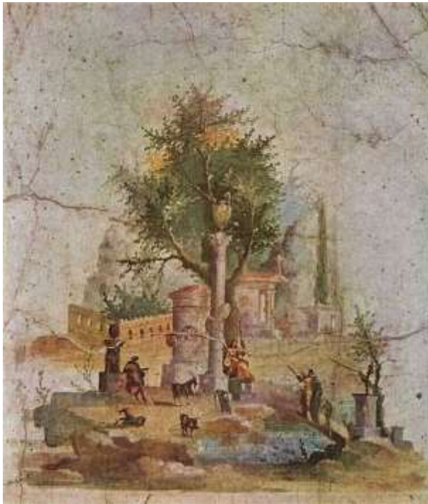
Antična freska v Pompeji