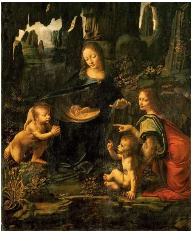
Leonardo de Vinci, Madona v votlini