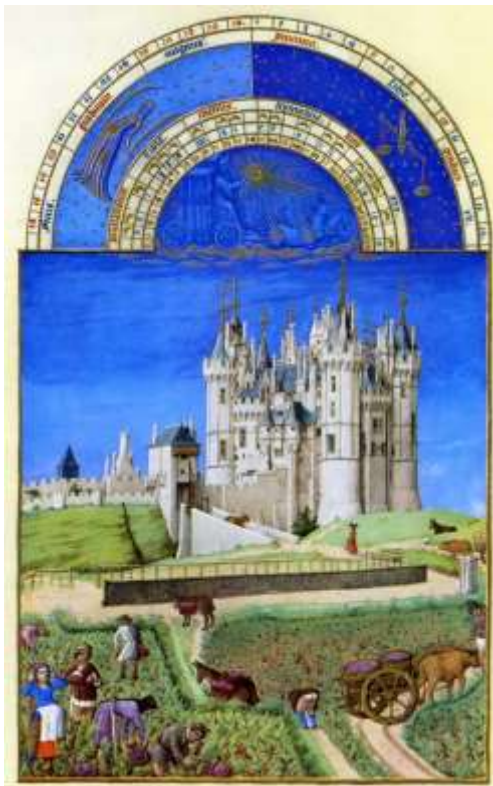
Sijajni horarij vojvode Berryjskega