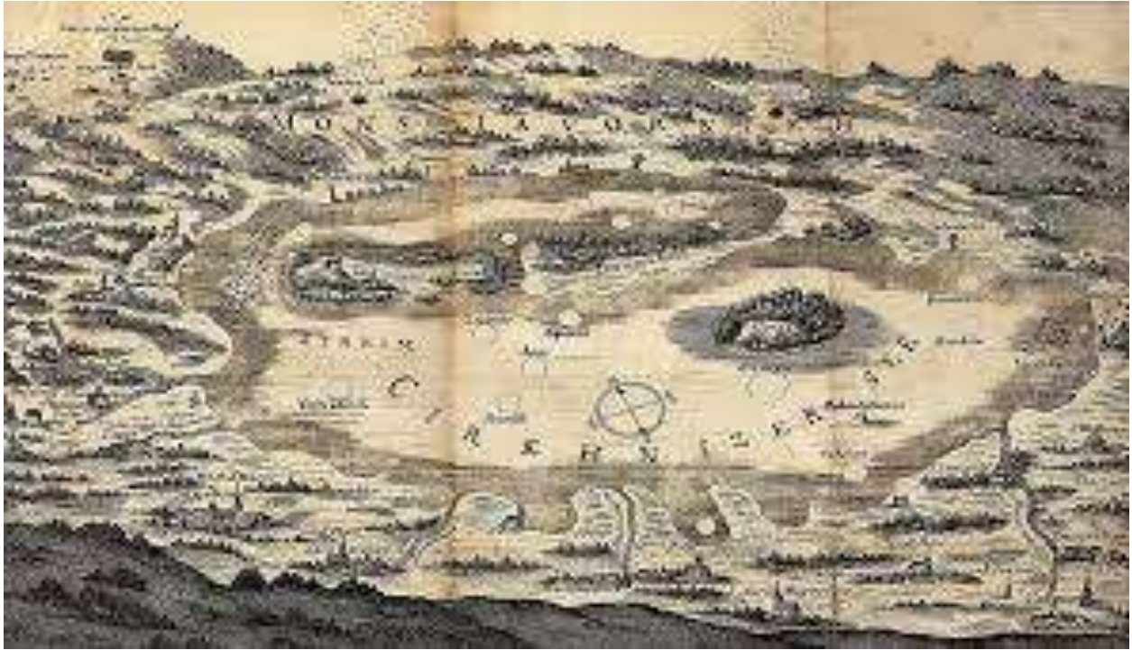
Cerkniško jezero v Slavi Vojvodine Kranjske