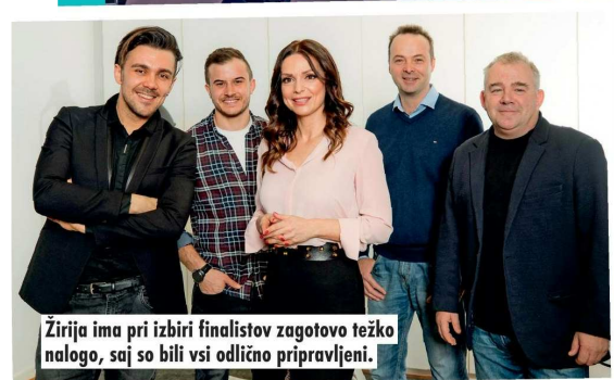
Žirija ima pri izbiri finalistov zagotovo težko nalogo, saj so bili vsi odlično pripravljeni.