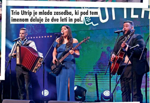
Trio Utrip je mlada zasedba, ki pod tem imenom deluje že dve leti in pol.