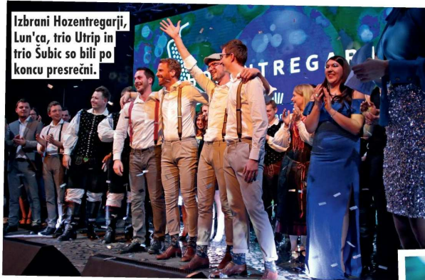
Izbrani Hozentregarji, Lun'ca, trio Utrip in trio Šubic so bili po koncu presrečni.