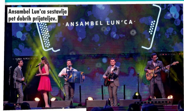
Ansambel Lun'ca sestavlja pet dobrih prijateljev.